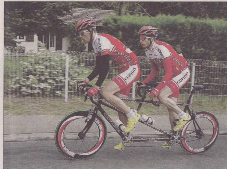
La coordination doit être parfaite pour les deux hommes afin d'éviter la chute notamment pour se mettre en danseuse

Des courses qu'ils peuvent maintenant faire avec le soutien d'Ada Melun qui leur prête un véhicule pour leurs déplacements : « Faire du cyclisme en tandem avec