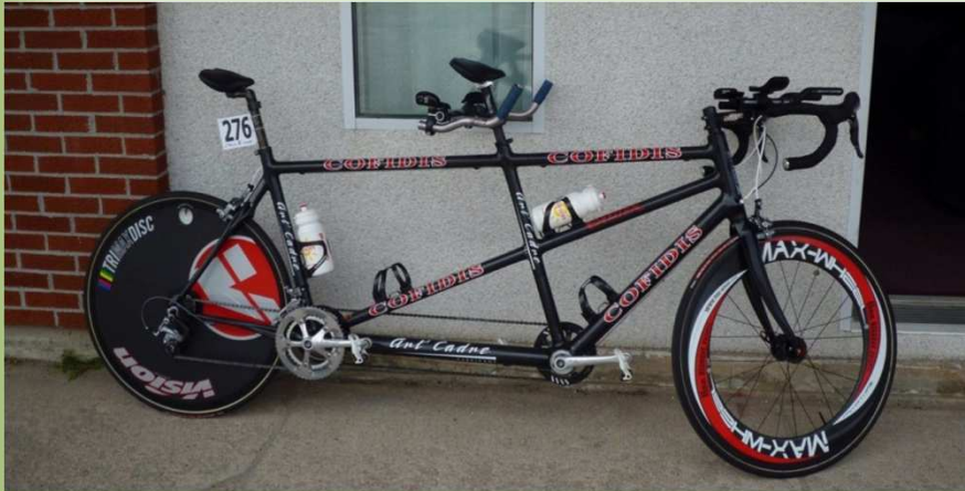
Tandem Contre La Montre Tandem Route